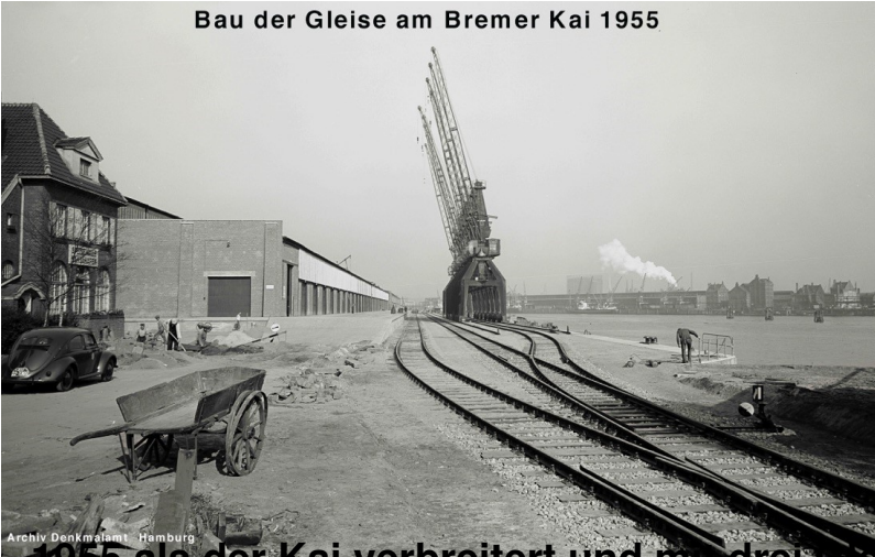
1955 als der Kai verbreitert und mit drei Gleisen ausgebaut wurde, Blick in Richtung