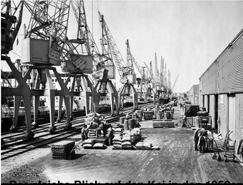
Der gleiche Blick auf den Kai in den 1950er Jahren