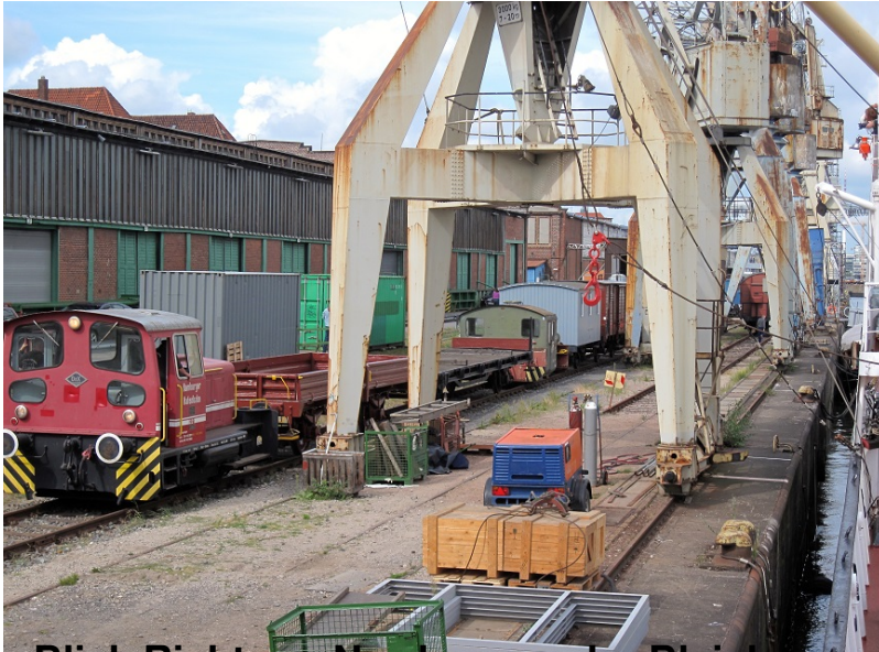
Blick Richtung Norden von der Bleichen auf unser Gleis mit Loks und Wagen