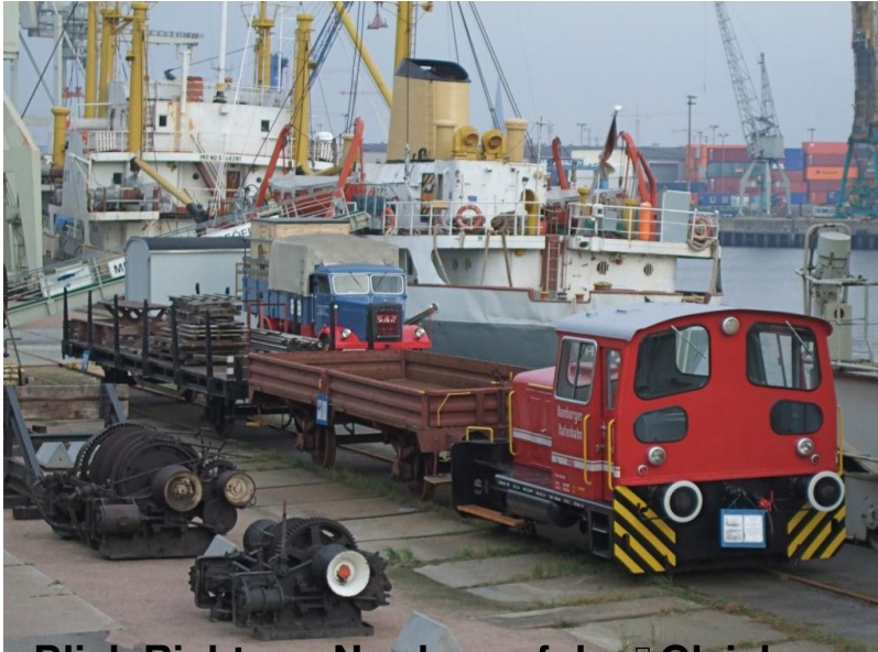
Blick Richtung Norden auf den Gleisbauzug