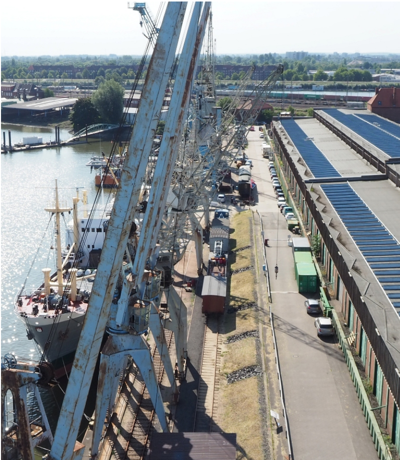
...und ganz unten im Bild bei den Kränen □ das Dach des Schuppens aus der Luft (