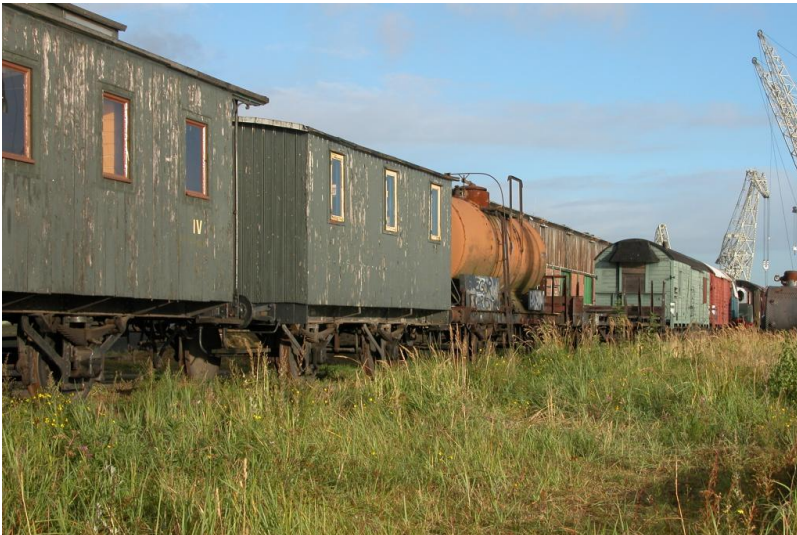
Als die Fahrzeuge zu uns kamen, Bick Richtung Norden Wasserseite