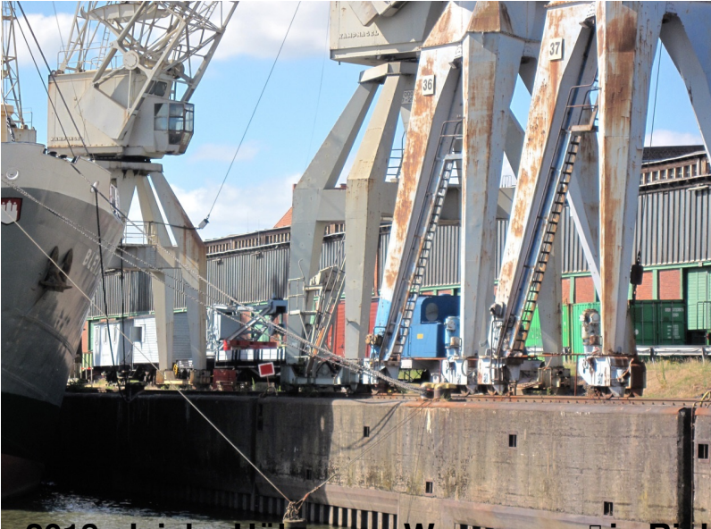
2018 gleiche Höhe vom Wasser aus in Richtung Süden