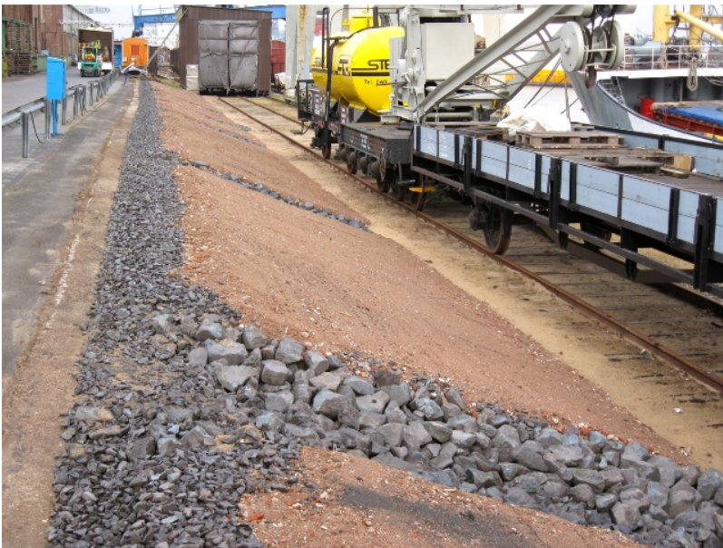
Und seit Herbst 2011 mit neu gestalteter Böschung