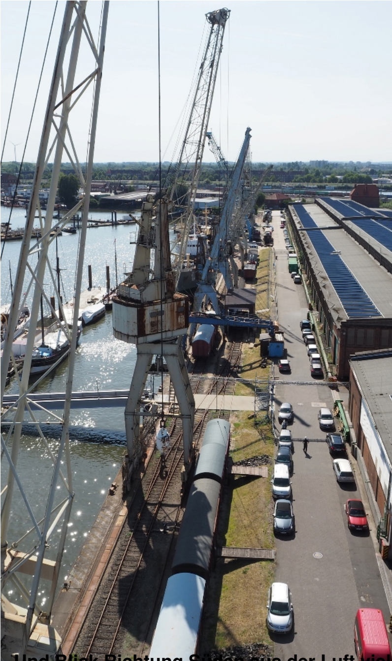
Und Blick Richtung Süden aus der Luft viele Jahre später