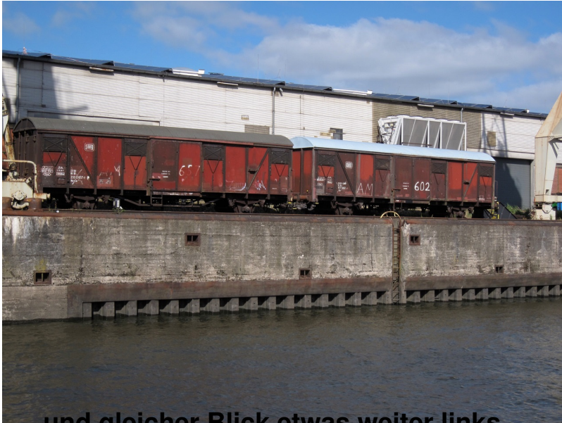
...und gleicher Blick etwas weiter links