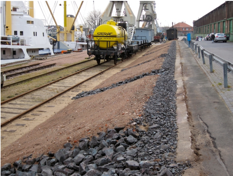
...seit Herbst 2011 mit Regenabläufen an der Böschung, die verhindern, dass der S