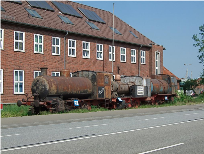
Unsere Dampflok am Veddeler Damm warten auf die Aufarbeitung, die Sanella (Update: Das Gleis am Veddeler Damm wurde 2020 abgebaut, die Sanella steht nun Die Tiefstack wurde abgegeben und steht nun als Denkmallok auf dem Straßenkrei