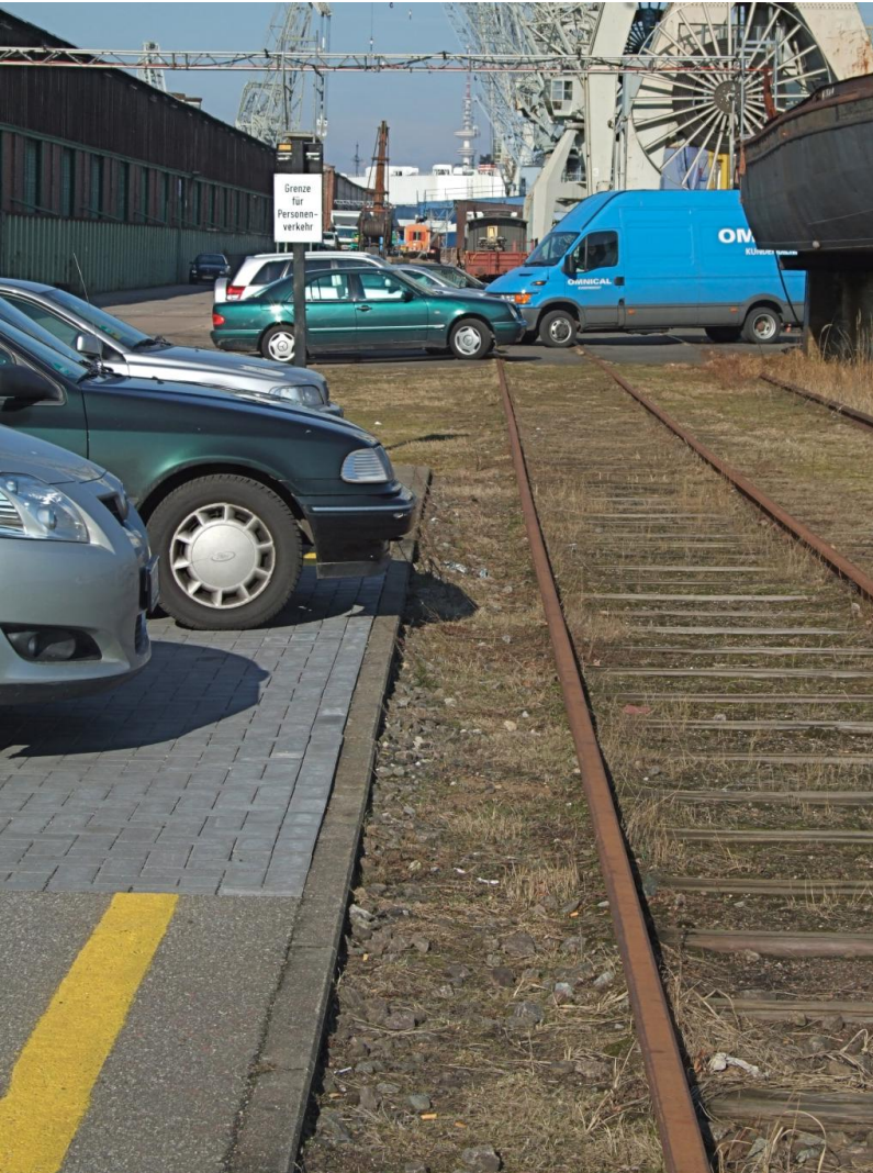
Blick Richtung Norden Unser Gleis wird leider oft zugestellt