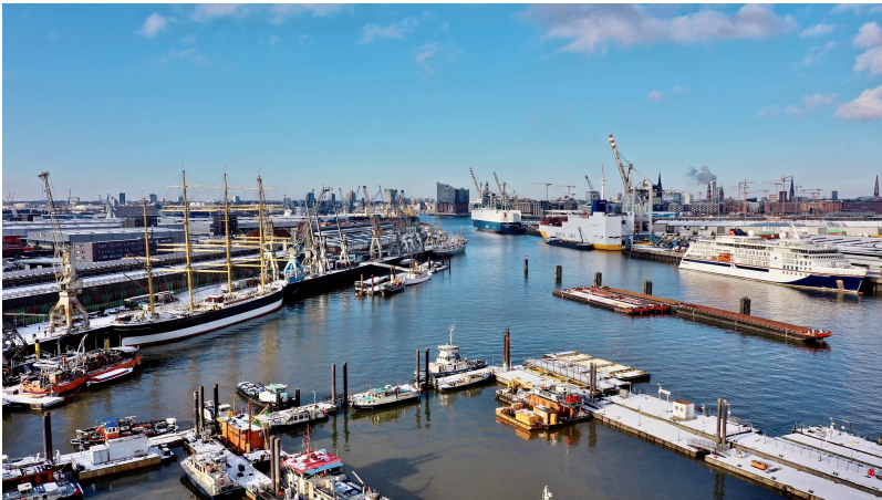
Luftbild vom Hansahafen mit der Peking links im Vordergrund am Bremer Kai und