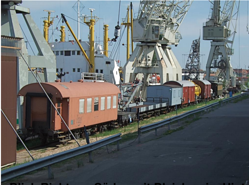
Blick Richtung Süden mit Bleichen im Hintergrund...