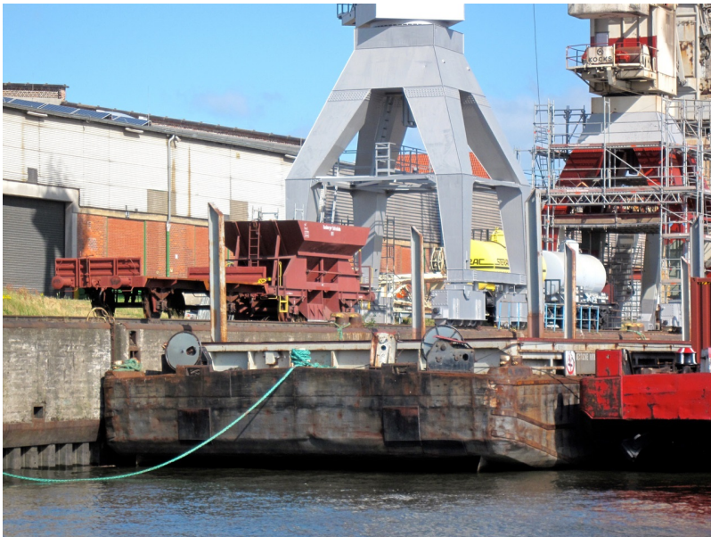
Ungefähr gleiche Stelle vom Wasser aus Richtung Norden ein paar Jahre später...