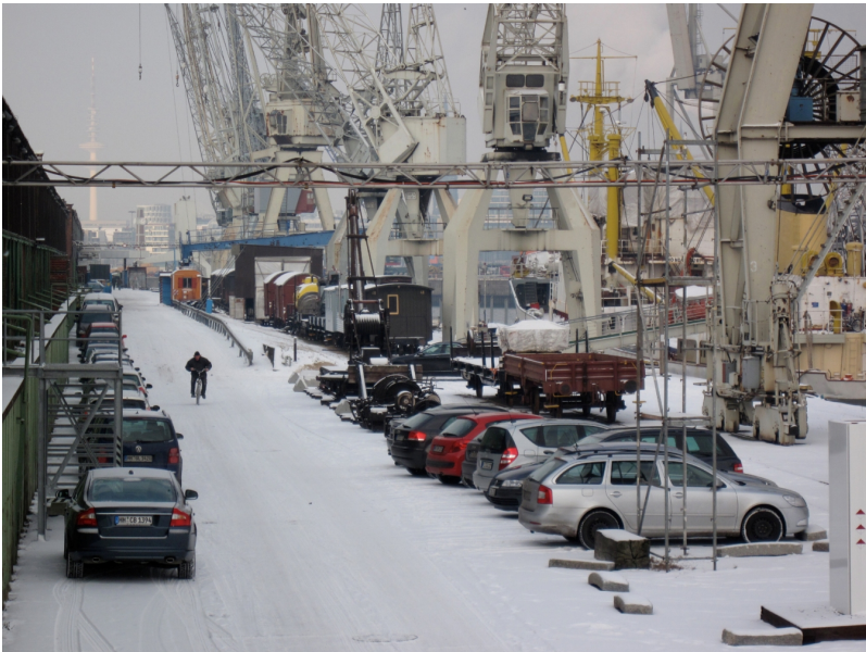
Das Ganze von der Flutschutzwand im Winter