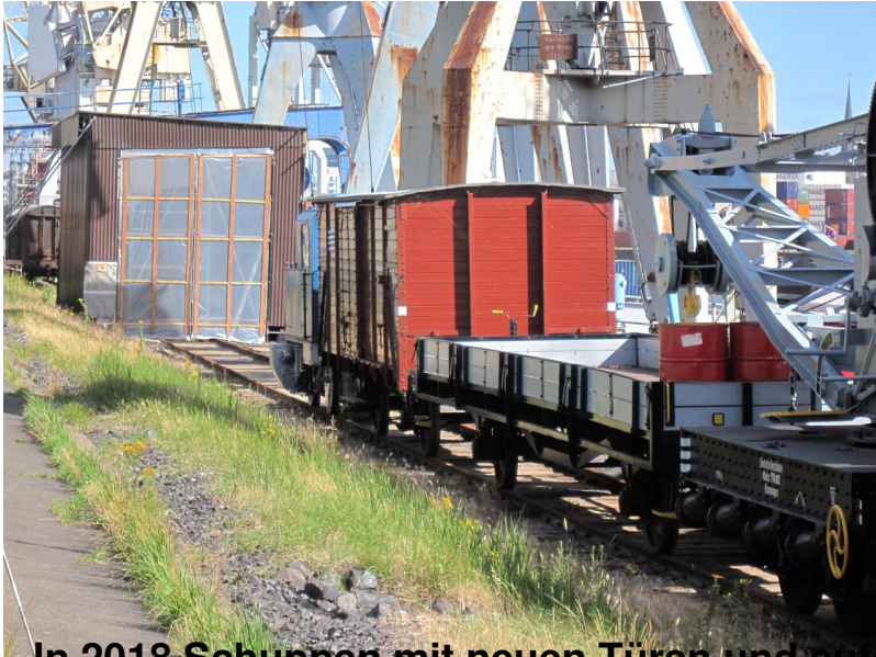
In 2018 Schuppen mit neuen Türen und aufgearbeitetem Hafenbahn-Zug