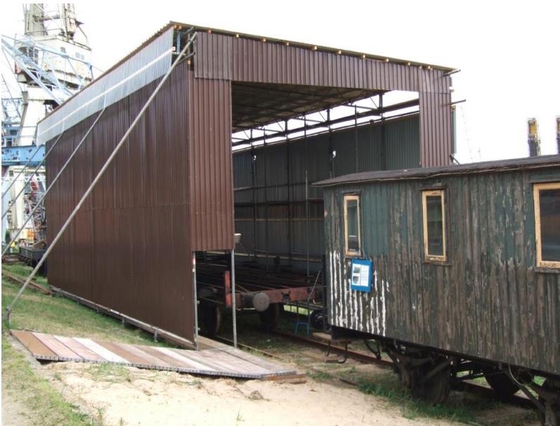
Schuppen mit Wagen zur Aufarbeitung