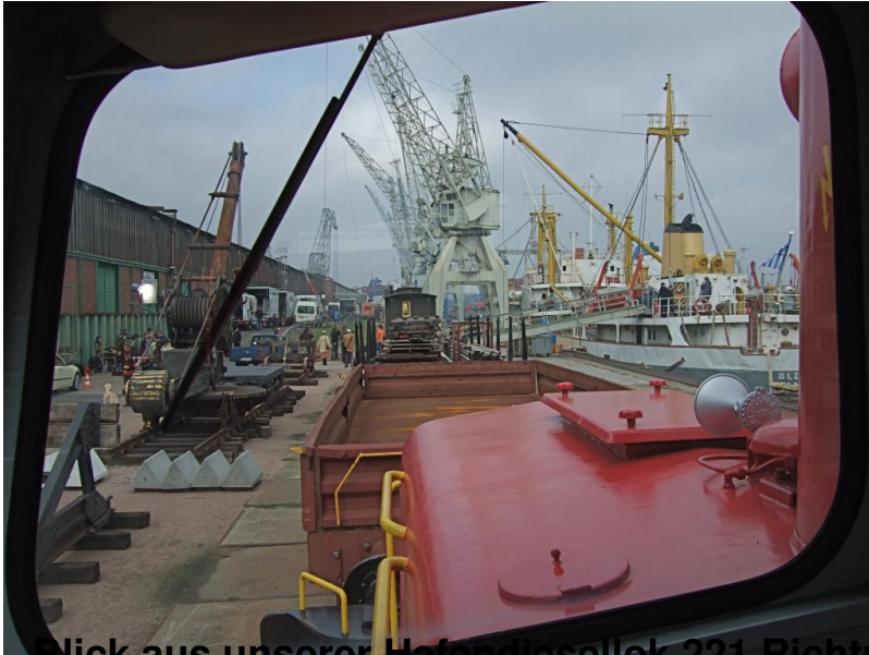
Blick aus unserer Hafendiesellok 221 Richtung Norden