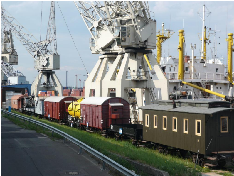
Blick Richtung Norden, rechts hinter der Fresskiste ist die MS Bleichen bereits vor