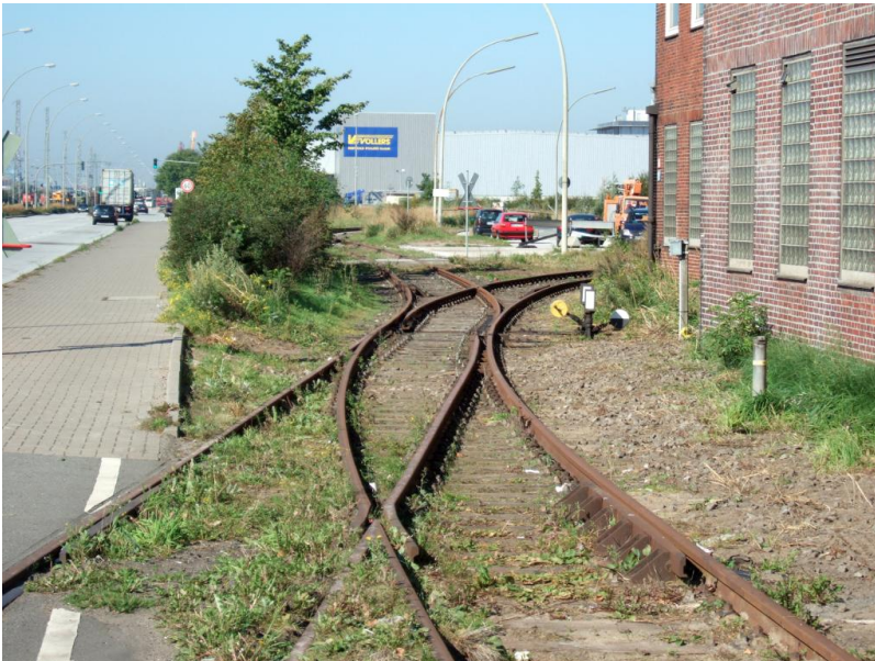
Einfahrtweiche zum Bremer Kai (rechtes Gleis) Im Vordergrund Weiche zur Überfahrt Veddeler Damm (linkes Gleis), das im Vorder