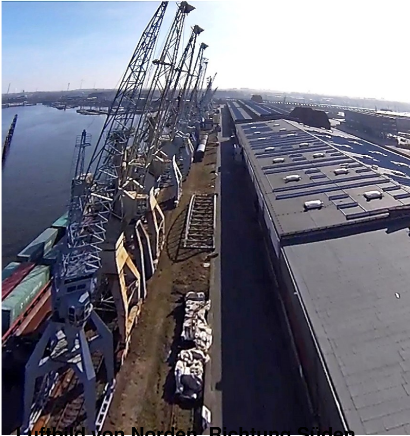
Luftbild von Norden, Richtung Süden