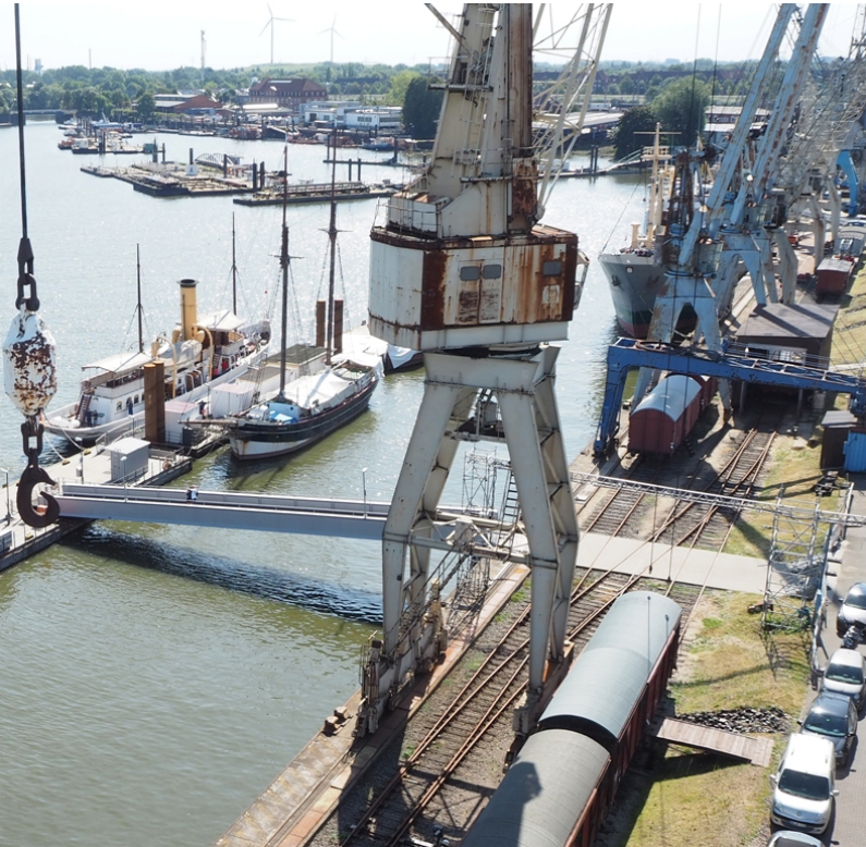
Blick von der anderen Seite (Schuppen rechts im Bild) mit Kranschiene Kreuzung