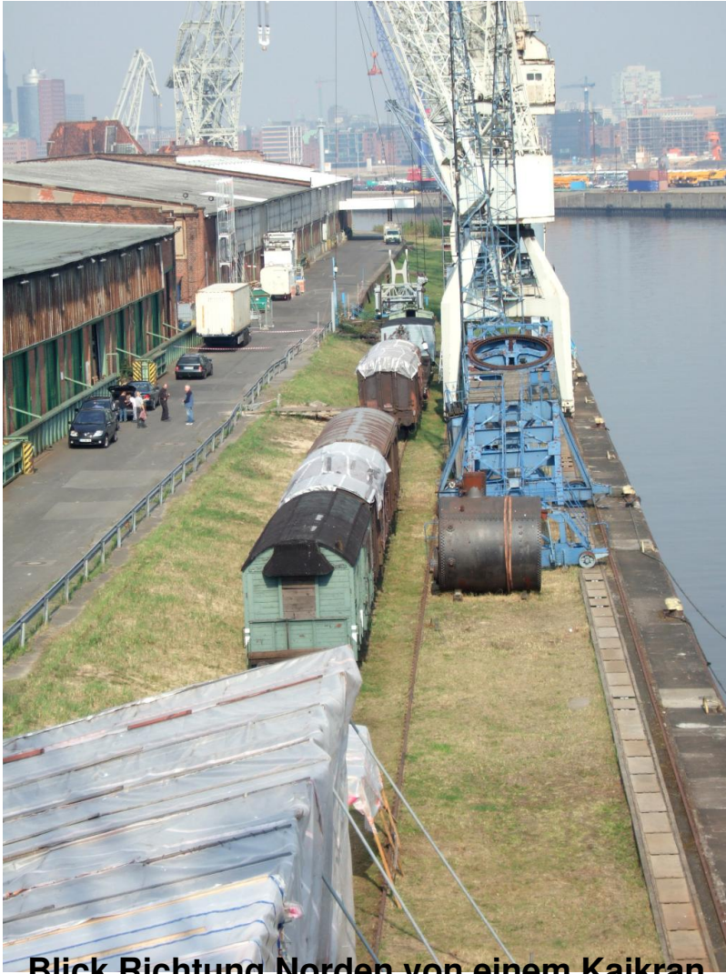
Blick Richtung Norden von einem Kaikran, im Hintergrund die Hafencity