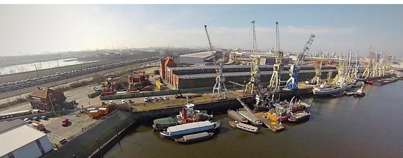
Luftbild Bremer Kai im Süden bis zum Einfahrtbogen