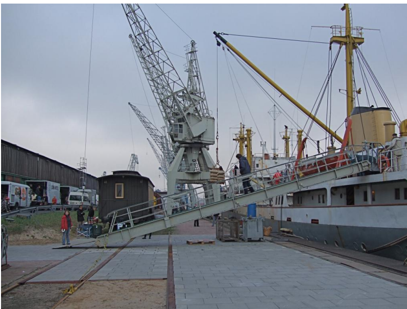
Blick Richtung Norden auf MS Bleichen und Fresskiste, bisher müssen wir zum R