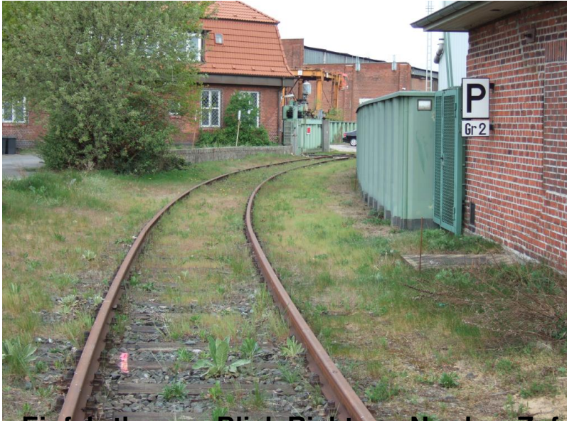
Einfahrtbogen, Blick Richtung Norden, Zufahrt zum Bremer Kai