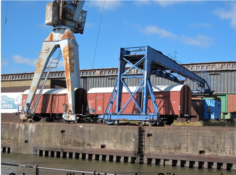
Schuppen (links hinter dem Güterwagen) vom Wasser aus...