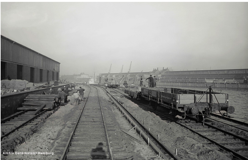
...und weiter Richtung Norden