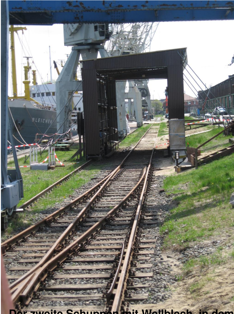
Der zweite Schuppen mit Wellblech, in dem die Fahrzeuge jetzt aufgearbeitet werden