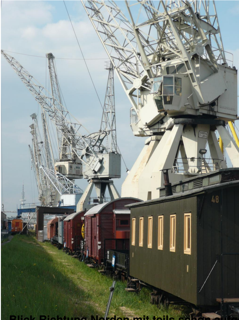
Blick Richtung Norden mit teils schon aufgearbeiteten Wagen