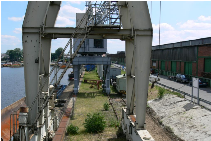
Richtung Süden (fast von der Kaispitze aus) Gleislage unter den Kränen, mittlerw