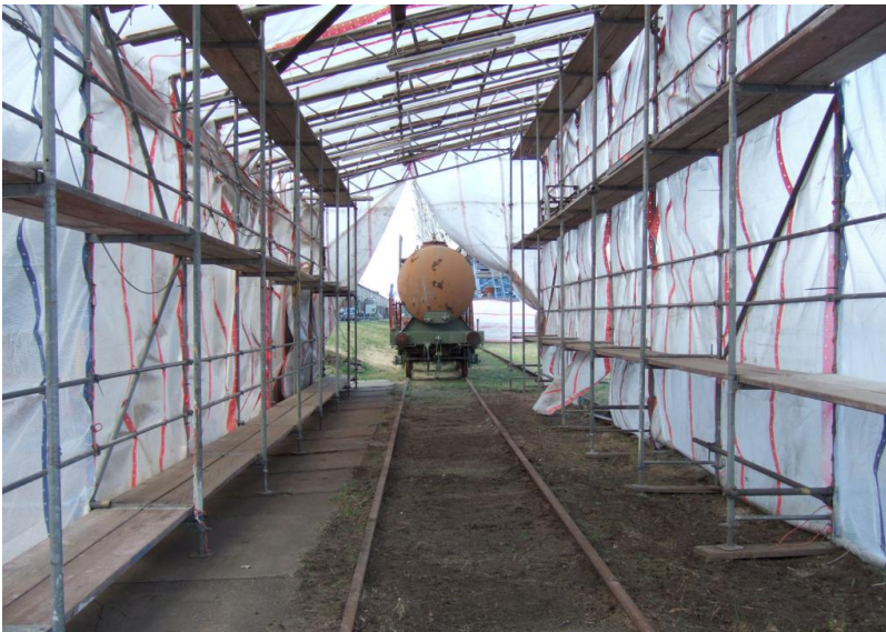
Der erste "Schuppen", nur mit Planen, in dem JiA (Jugend in Arbeit e.V.) die Fahrz