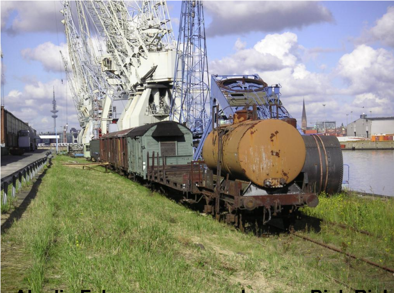
Als die Fahrzeuge zu uns kamen, Bick Richtung Norden Schuppenseite