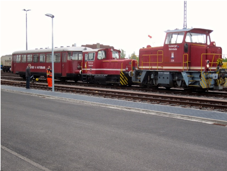
Überführungsfahrt 2015 zur Begutachtung hinsichtlich der erforderlichen Haupttur