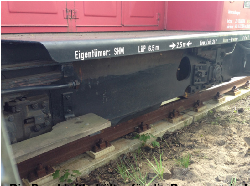
Die Druckluftbehälter für die Bremsen sind demontiert, sie müssen erneuert werden