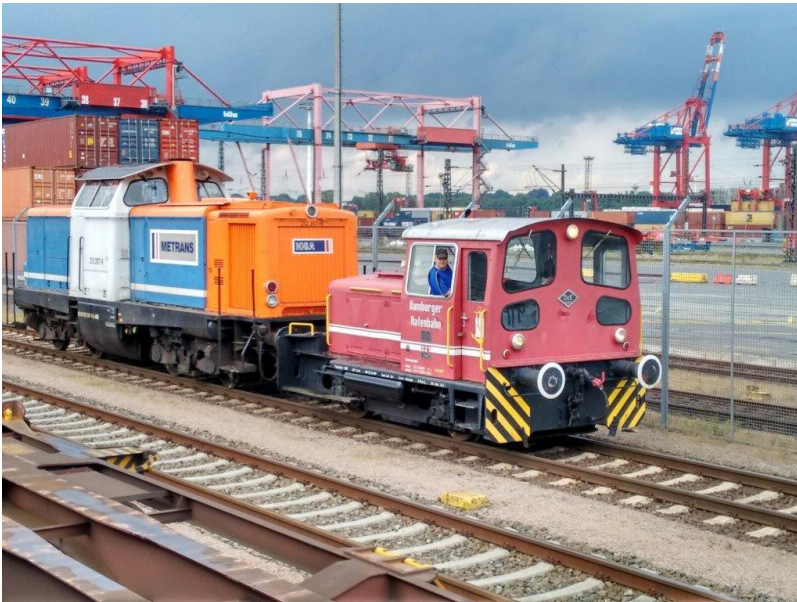
Die Arbeiten sind erledigt, die Rücküberführung wurde für eine Lastprobefahrt genutzt