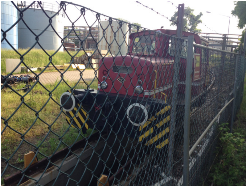
...auf einer Grube zur Durchführung der HU Anfang Juni 2016