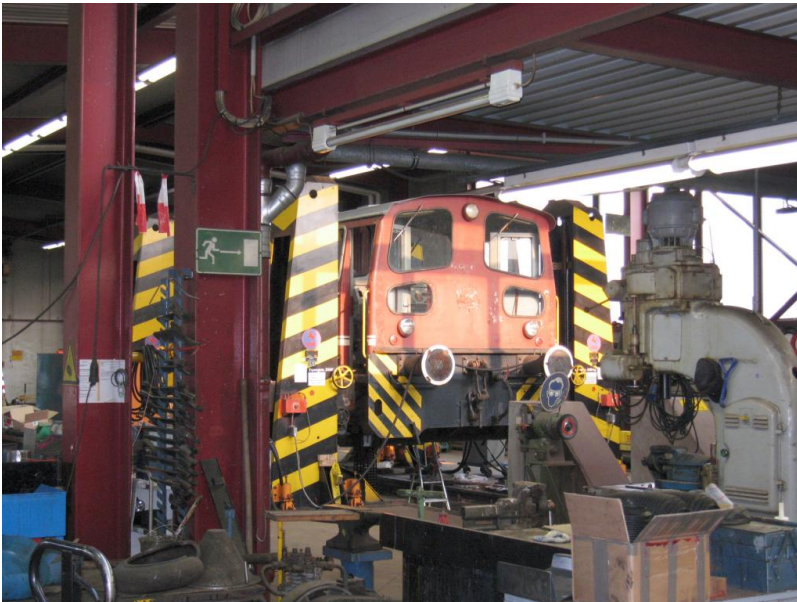
AKN-Werkstatt Billbrook Hauptuntersuchung