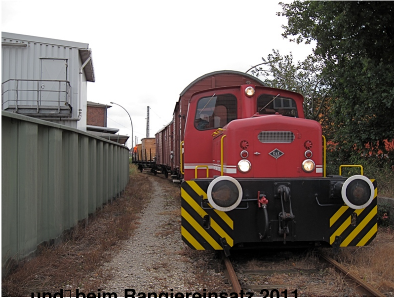
...und beim Rangiereinsatz 2011