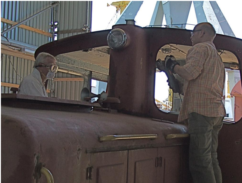
Bei der Aufarbeitung 2008