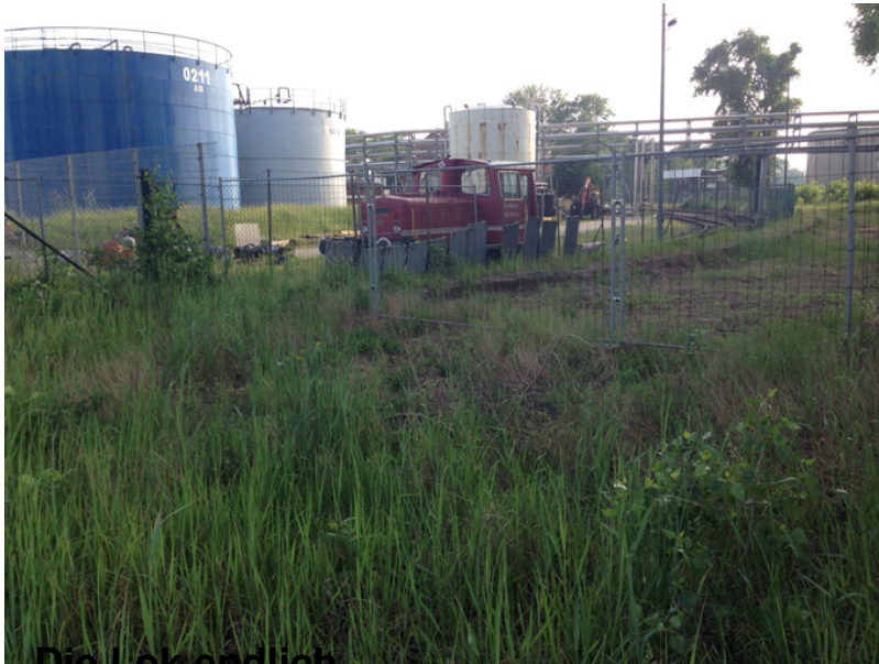
Die Lok endlich...