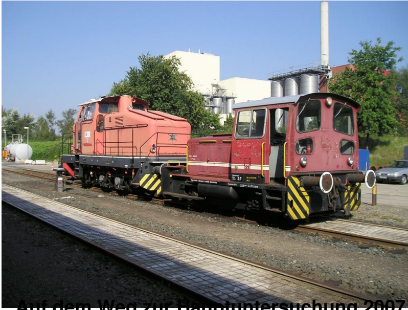
Auf dem Weg zur Hauptuntersuchung 2007