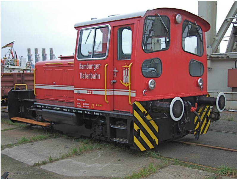
221 Hafen-Lok aufgearbeitet 2009...