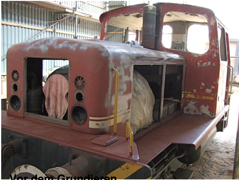
Vor dem Grundieren