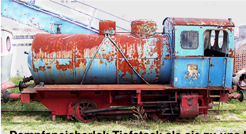
Dampfspeicherlok Tiefstack als sie zu uns kam 2004